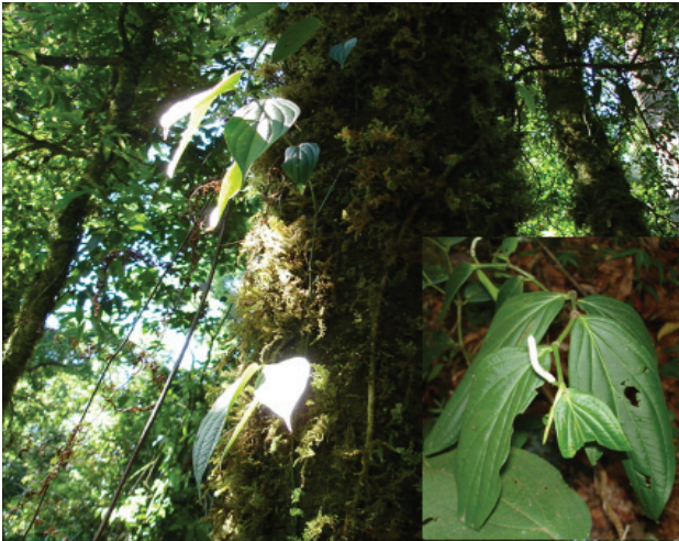
Figura 3. Piper xanthostachyum (G. Castillo C. et al. 21359) en el bosque mesófilo de La Cortadura, Veracruz.

al raquis, y de la segunda porque sus inflorescencias no son rosadas o moradas ni opuestas a las brácteas florales (Tebbs, 1989). Además, ninguna de las 2 especies alcanza en su distribución a México (Tebbs, 1989), mientras que P. xanthostachyum es una especie común en los bosques mesófilos de montaña de Costa Rica y Guatemala (Standley y Steyermark, 1952), y también se ha registrado en El Salvador, Nicaragua, Panamá y Ecuador (Tebbs, 1989; Flora Mesoamericana, 2007). En México P. xanthostachyum se conoce de Oaxaca y Chiapas donde se encuentra entre 1400–2850 m snm (Breedlove 1986). No había sido registrada previamente para el estado de Veracruz, por lo tanto este registro significa una notable extensión de su límite anterior de distribución septentrional.