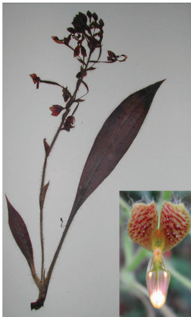
Figura 2. Ejemplar de Ponthieva brenesii (G. Castillo C. et al. 21370), y acercamiento de una flor.

El género Piper tiene aproximadamente 2 000 especies pantropicales (Mabberley, 1997), y de todas las especies americanas sólo 8 presentan el hábito trepador (Tebbs, 1989). En el estado de Veracruz se han registrado casi 90 especies (Sosa y Gómez-Pompa, 1994), aunque ninguna con hábito trepador. Piper xanthostachyum (Fig. 3) es una planta trepadora sobre troncos de árboles, alcanza hasta 15 m de altura, sus tallos son glabros, con ramas nudosas y